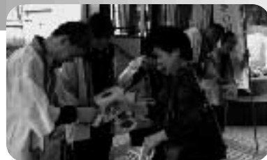
街頭募金(朝霞台駅にて)

朝霞市民生委員児童委員協議会 立正佼成会朝霞教会 ボーイスカウト朝霞第1・2団 ガールスカウト埼玉支部28団 地域活動支援センター 知的障害者通所授産施設 あさか福祉作業所 社会福祉協議会役職員 Special thanks JR北朝霞駅 東武東上線朝霞駅・朝霞台駅