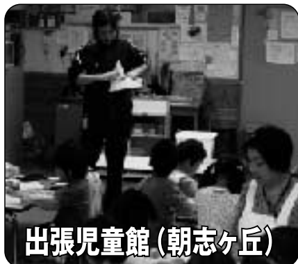
出張児童館（朝志ヶ丘）

児童館との交流事業です。児童館と放課後児童クラブは社会福祉協議会が運営しています。