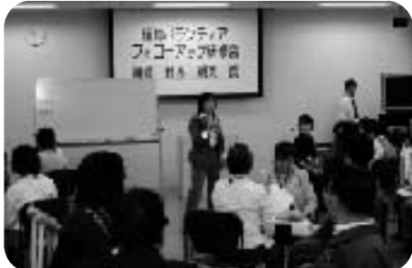
ボランティア 育成・啓発活動