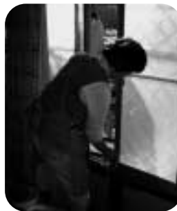
住民参加型在宅 福祉サービス ふれあいサービス