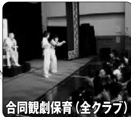
合同観劇保育（全クラブ）