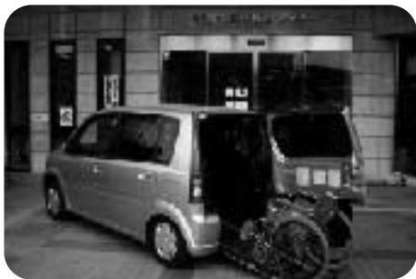
福祉有償運送サービス リフト付自動車貸出